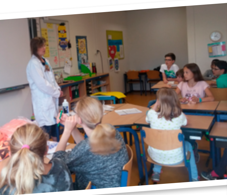
Op onderzoek uitgaan met een scheikundig expert

(kenmerken uit Ondernemend onderwijs, uitgangspunt voor het onderwijs van de toekomst , 2015, Jong Ondernemen en Raad voor Ondernemend Nederland)