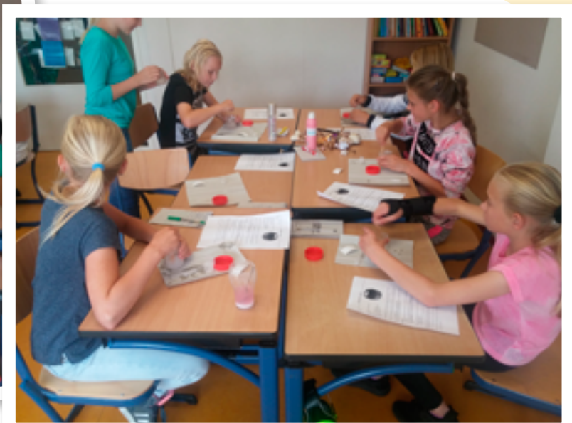
Zelf gel maken